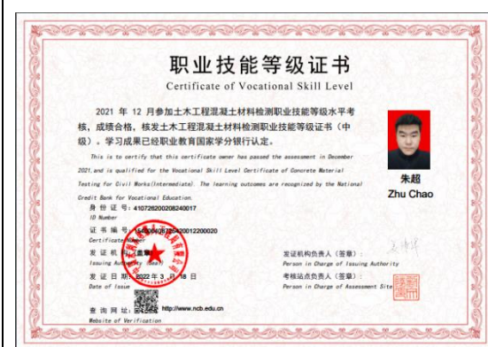
职业技能等级证书