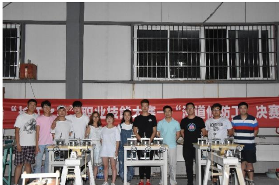
“长江之星”技能大赛