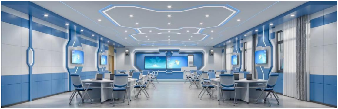
智慧数字水利实训室

中央财政支持建设的水利水电建筑工程专业校内水利实训大厅一个，并有 14 个专业实训室、1 个智慧水利实训室、1 个首席技师工作室、1 个专业机房，共有 200 余台电脑及各种实训设备。